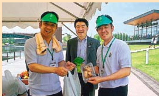
福島産野菜のチャリティー販売会を実施