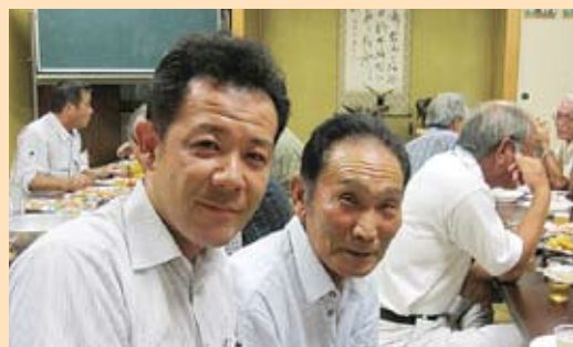
中沖公民館にて県政報告会