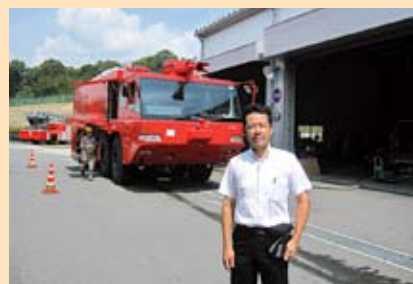
空港用化学消防車製造工場視察