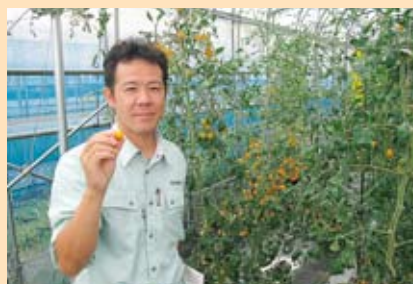
ミニトマト栽培現地視察