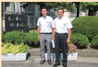
富山東高校現地視察