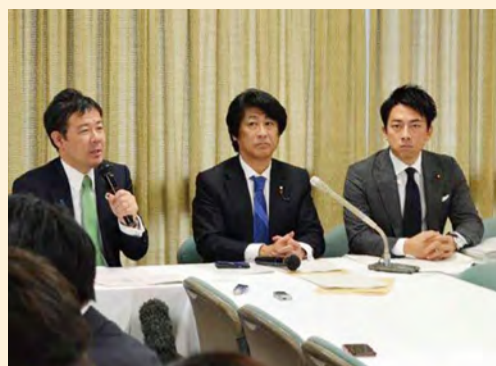
▲国民起点PT会議 記者ブリーフィングにて